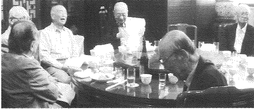
久方の悲・歎・親・笑の賑わい

を越える体調不良、臥床、他界、認知症の進行等、によって逐次閉会、停止の憂目を迎えている中で、当相武60期は、まだまだ頑張りたいという意気込みが熾んである。