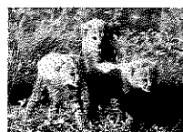
写真「生後一週間(チータ)」