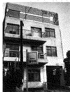
昭和56年の偕行社(五番町)