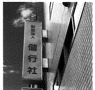
現在の偕行社 (九段南)

会員は全国にまたがり、平成30年4月現在、その数は約6,000名を数えています。そのうち、陸軍將校の伝統を引き継ぐ元幹部自衛官の会員は約3,000名です。更に、個人・法人の賛助会員も増加しつつあります。