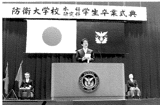
防大卒業式で訓示する安倍総理 (2020)

安倍前総理は、健康上の理由で辞任されましたが、毎年の防衛費増額（安倍政権下で13%増加）を始め、在任間に成し遂げた安全保障に関する成果は極めて大きなものがあり、内外から高く評価されました。以下に、主要成果をまとめました。