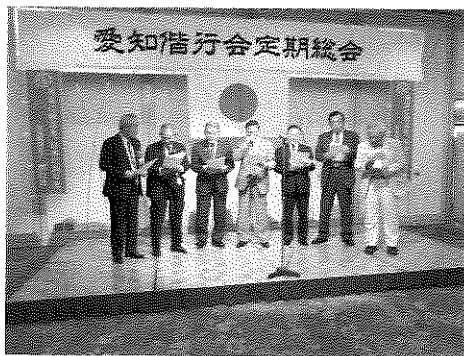
陸自OB会員代表の幹部候補生学校校歌の斉唱