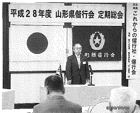
※このところからの偕行社・偕行会 山形県偕行会

総会は、14時から開始され「開会のあいさつ」の後、「国歌斉唱」次いで、「国の鎮め」の音楽に合わせて、戦没者自衛隊殉職隊員、物故会員の御霊に「黙祷」を奉げた。