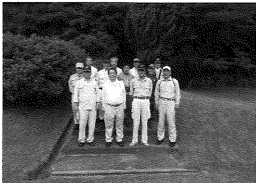
陸軍墓地清掃を終えて集合写真