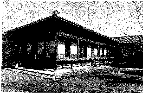
至善堂(重要文化財) 建物