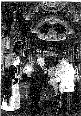
2006年御訪問

国王は王妃と共に王朝で最も存在感を示し、国民の敬愛と信頼を受け、国家の安定に努めてこられたこと、世界で最長の在位となったことなど、長く歴史に残ると思われる。ご冥福を心から祈りする。