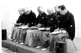
楽謡会による謡曲「義経物語」