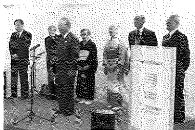
詩吟:「戦国武将と詩歌」から 練馬和漢朗詠会