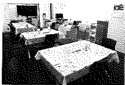
談話室 (BC 室通し時)