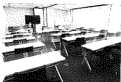
会議室 AB (スクール形式)

● 大型モニター(無料)を使用してのリモート会議もできます。 ● 自動給茶機は無料、飲み放題です。当社で販売している食品等の飲食のほか、お弁当の注文、持ち込み等も可能です。 ● 大勢でご利用の際は、ケータリング会場としてのご利用も可能です。ご来場をお待ちしております。