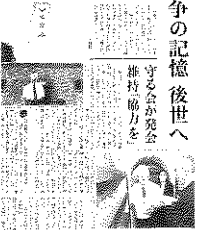
「東奥日報」掲載記事

陸奥新報では、タイトル「平和の尊さ後世に 守る会発足、存在周知 益や彼岸本堂公開 戦没者供養弘前忠霊塔」と共に忠霊塔と式典会場のテントの写真と本堂前に掲示された青森県戦没者銘板を確認する参列者の写真が掲載された。