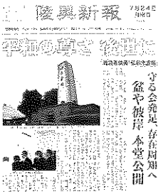
「陸奥新報」掲載記事

陸奥新報では、タイトル「平和の尊さ後世に 守る会発足、存在周知 益や彼岸本堂公開 戦没者供養弘前忠霊塔」と共に忠霊塔と式典会場のテントの写真と本堂前に掲示された青森県戦没者銘板を確認する参列者の写真が掲載された。