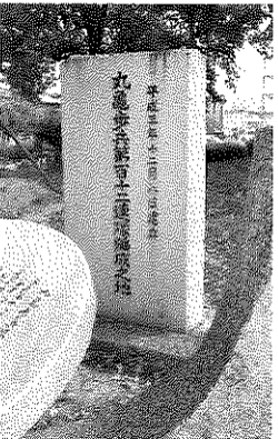
【写真】丸亀歩兵第百十二聯隊編成之地 記念碑】

歩兵第112聯隊の歴史については、HP「丸亀護国神社奉賛会」に追加掲載しています。